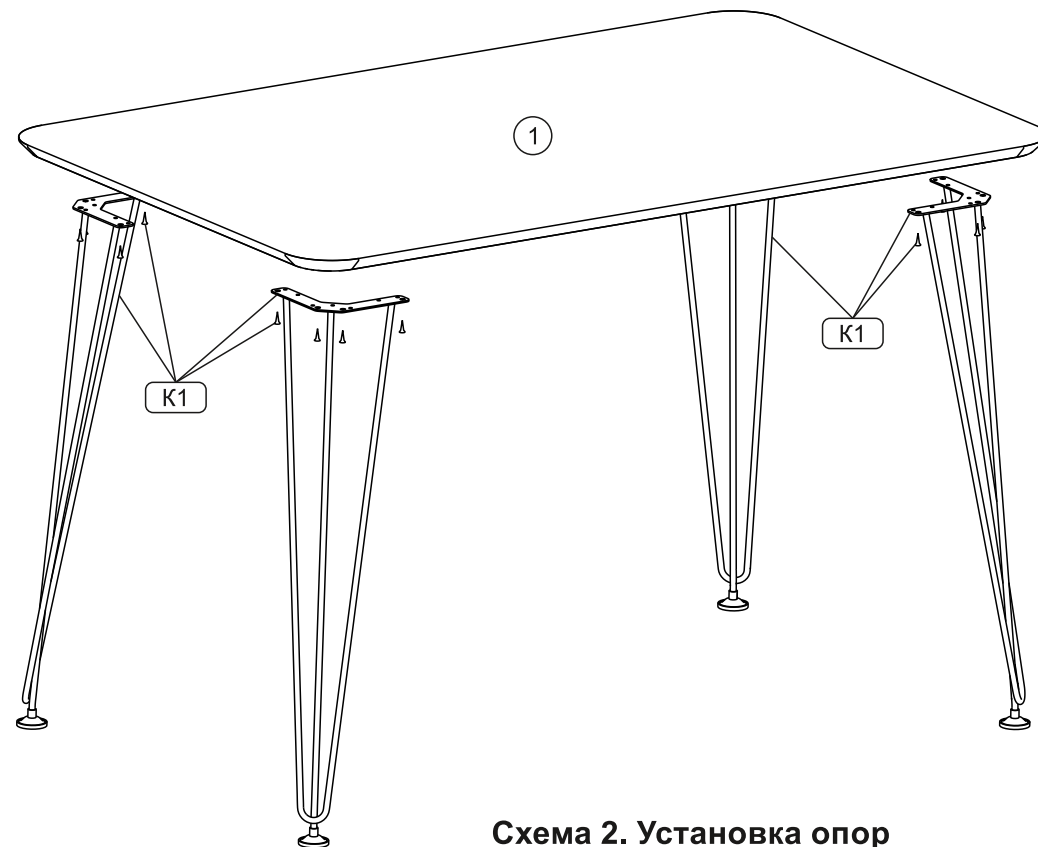
Схема 2. Установка опор